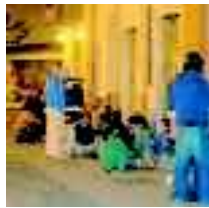
In via del Pratello per tutta la giornata grande festa per la Liberazione

Libri, giochi e spettacoli questa è una bella Resistenza