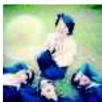
La band "Il vaso di Pandora" è fra i gruppi che si esibiscono nel parco

Un palco per giovani band a tutto rock, reggae e punk