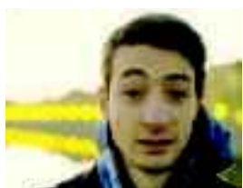
SpinOFF è uno degli artisti presenti al concerto in Montagnola oggi a partire dalle ore 18

Chiude all'insegna dell'elettronica l'estate in musica del Parco della Montagnola, con l'Homework Summer Festival. Per la prima volta all'aperto, la rassegna non cambia la sua filosofia, quella di ricercare i nuovi talenti dell'elettronica fuori dai cliché mainstream. Ad aprire il collettivo Concrete Bologna Elettroacustica e lo show-case presentato dalla trasmissione radio Mixology. Ancora, il duo Life's Track, il funk di SpinOFF e gli Apes on Tapes. Unica presenza internazionale sarà quella del giovanissimo inglese HWood (aka Jake Affleck), con un dj set a suon di Uk basse postdubstep. In chiusura, prima assoluta dal vivo per P+K (Paper plus Knife) e Lips Against The Glass. Inizio alle 18, ingresso gratuito. (lu. bor.)