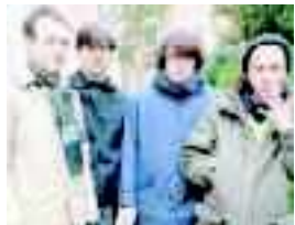
Il gruppo bolognese The Tunas alle 21,30 suona sul palco in vicolo Bolognetti

Giocano in casa, stasera, i The Tunas, i regaz bolognesi che ormai sono cresciuti e si avvicinano al decimo anno di attività. Al Bolognetti Rocks (inizio 21,30, offerta libera) presentano il terzo, omonimo disco. Nel segno del rock'n roll, naturalmente, perché questo è tutto quello che sanno fare, da sempre. Del resto, i The Tunas rimangono fedeli alla strada delle origini, quella del garage-rock anni '60, seguita con coerenza. Iniziano cercando di imitare le compilation più oscure e gruppi tipo Tell-Tale Hearts, ma piano piano i loro orizzonti si aprono verso hardcore punk, influenze pop e soul. Fino a trovare la loro dimensione, quella che porteranno anche stasera sul palco nel Vicolo. (lu. bor.)